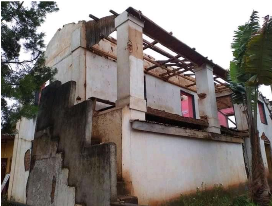
Lycée public Imerintsiatosika