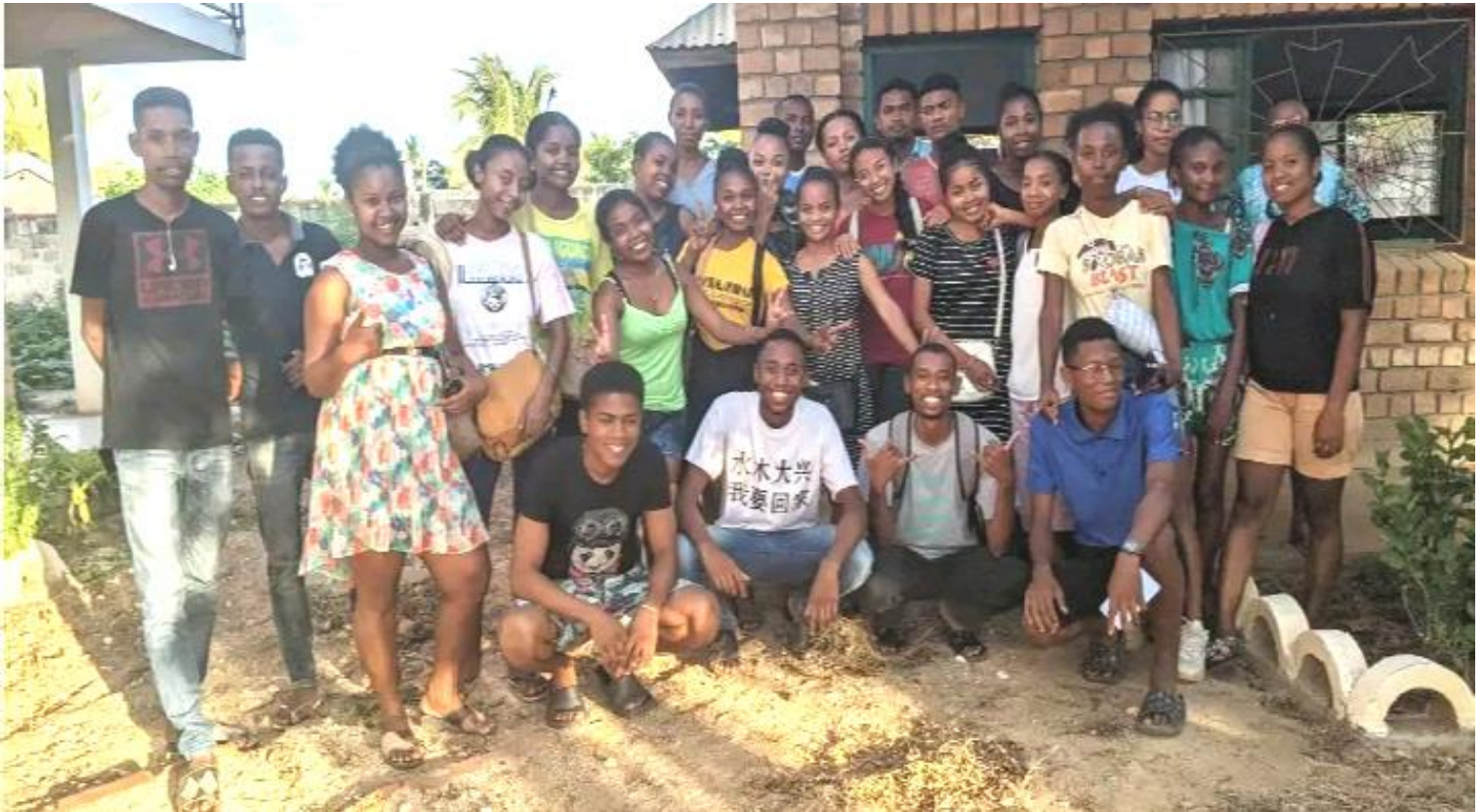
Les filleuls de Tuléar