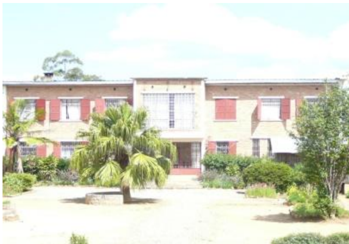
Maison des sœurs

Le district de Manjakandriana compte 20964 habitants, une population à très forte densité et très jeune : plus de 60% ont moins des 20 ans.