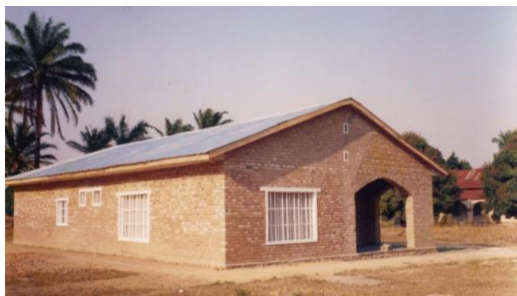
Maison du docteur