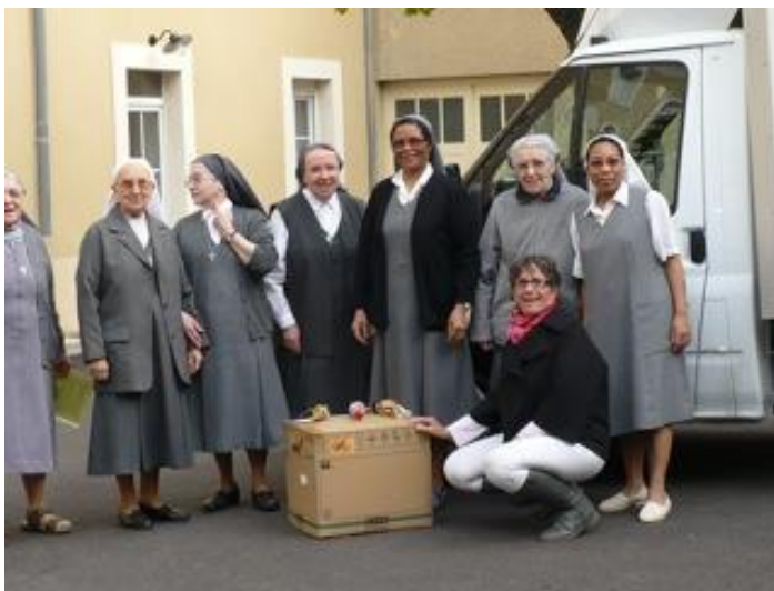
Les sœurs de Tournon devant le camion prêté par Intermarché - 1 er chargement