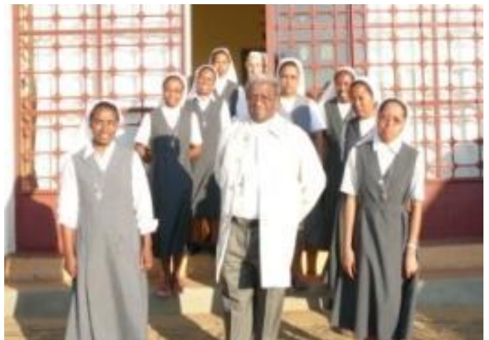
Les sœurs de la communauté autour de leur évêque