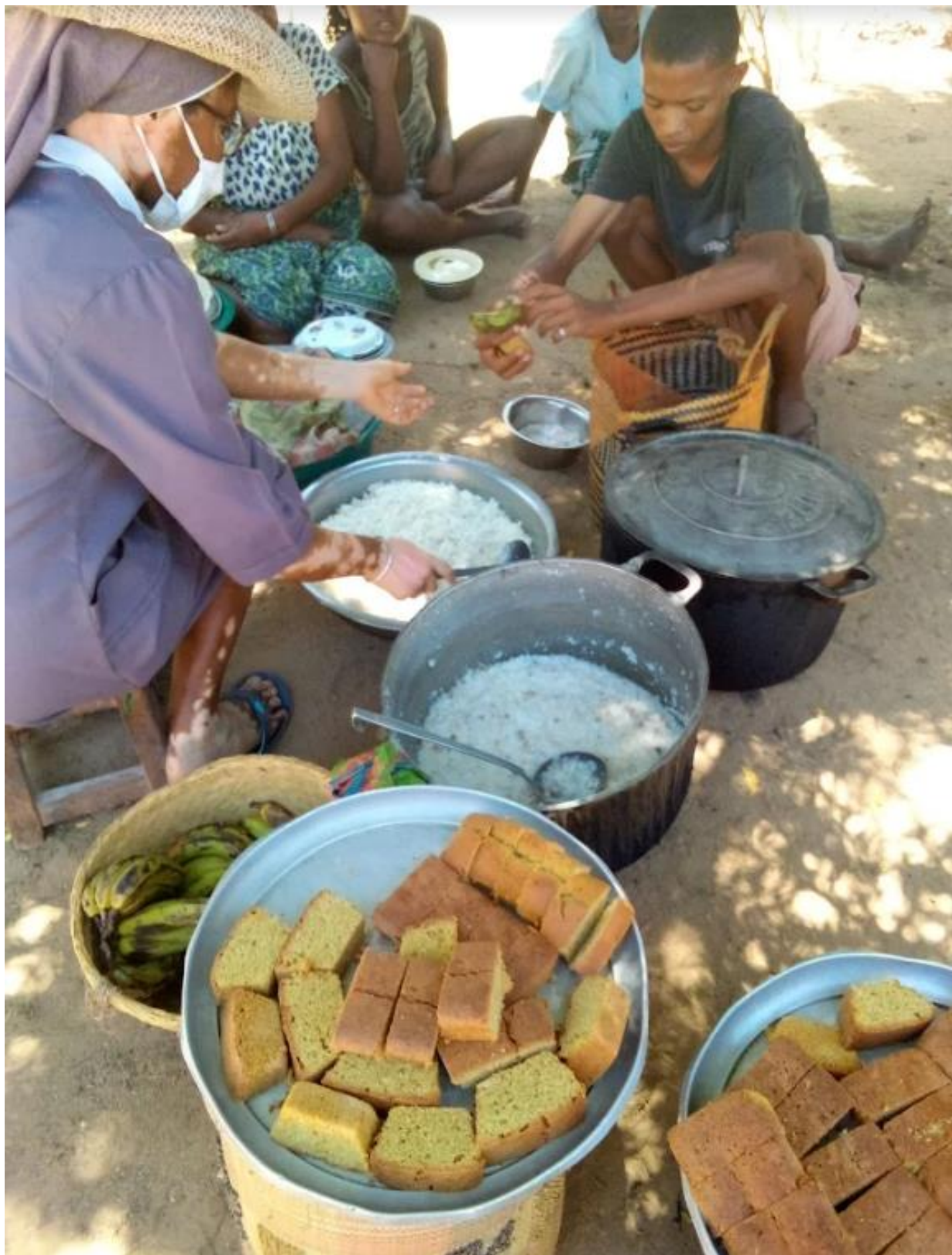
Grâce à vous généreux donateurs d'AMM , ce repas préparé par les sœurs St Paul de Chartres est un véritable festin pour les gens affamés du sud de Madagascar.