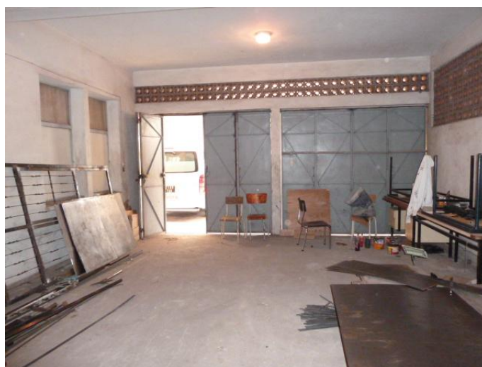
Vue des pièces qui doivent être aménagées