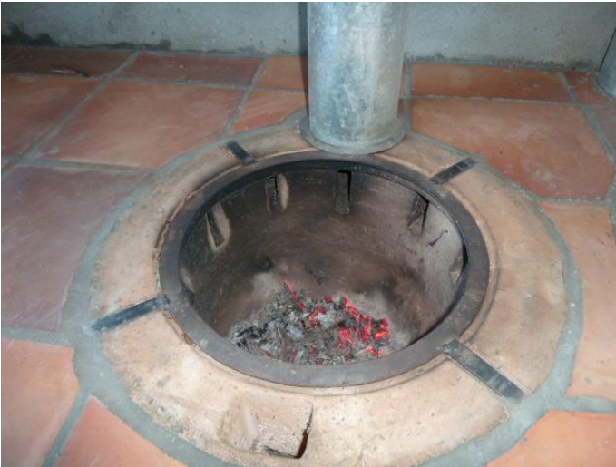
Les poêles à biomasse en activité

Suite des photos de Vincent PIRRITANO concernant la construction du couvent