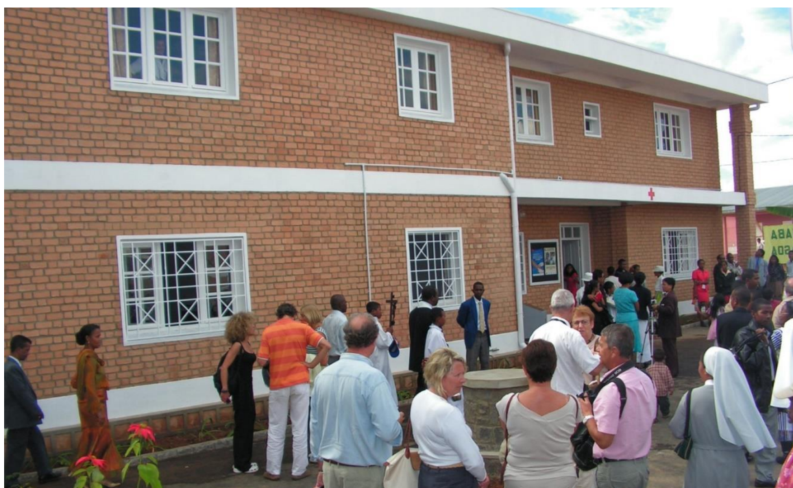
Le dispensaire Padre Pio, le jour de son inauguration en 2008.