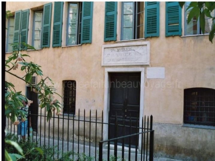
La maison natale de Napoléon