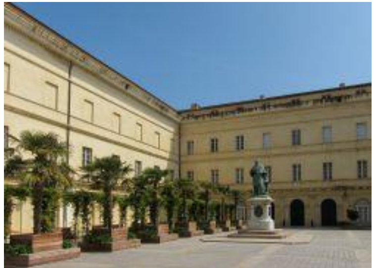
Le musée Fesch.

Déjeuner en ville ; ensuite on pourra aller faire un petit tour en voiture jusqu'à la Tour de la Parata d'où on a une belle vue sur l'Archipel des Sanguinaires : https://fr.wikipedia.org/wiki/Archipel_des_Sanguinaires